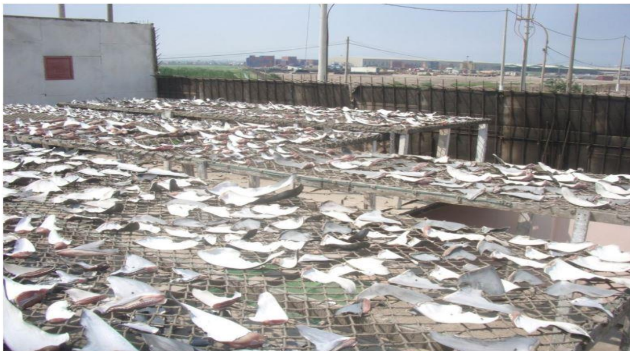
Secadero de aletas de tiburón en el Callao en el año 2007.